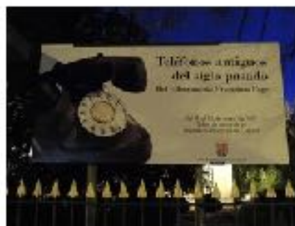
Cartel de la exposición en la entrada exterior a la Diputación