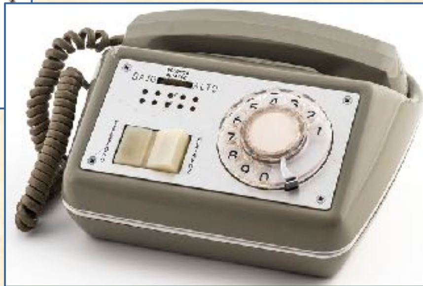
GTE Automatic Electronic Yvory, 1975, con altavoz, precursor de los manos libres