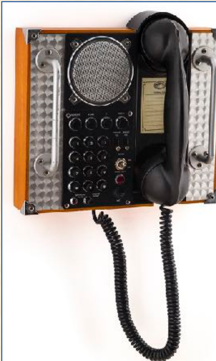
Spirit of St. Louis