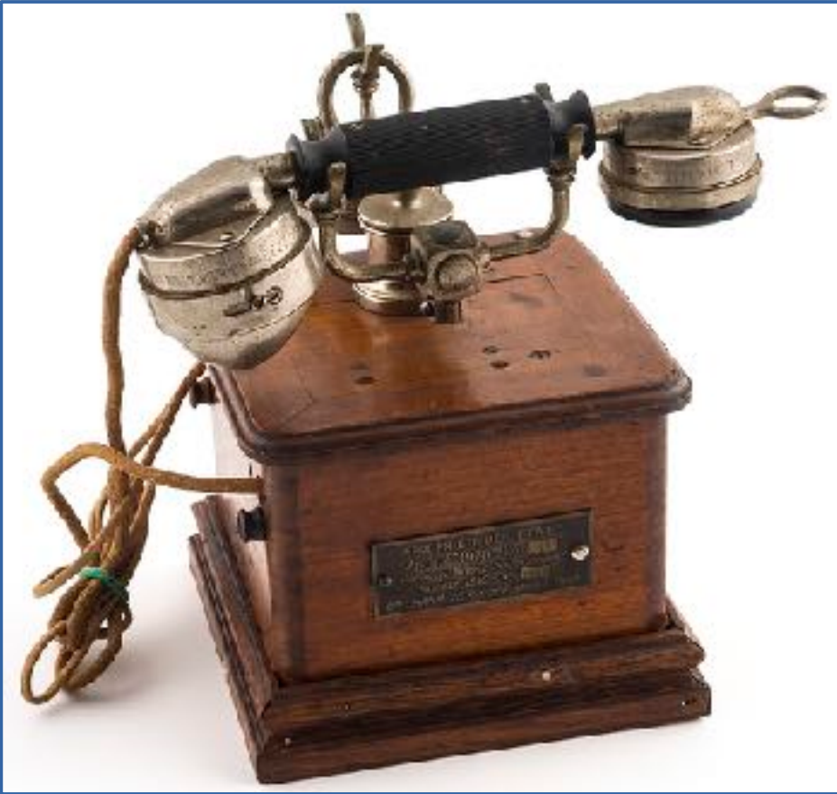
Teléfono francés, L. Hamm, 1910