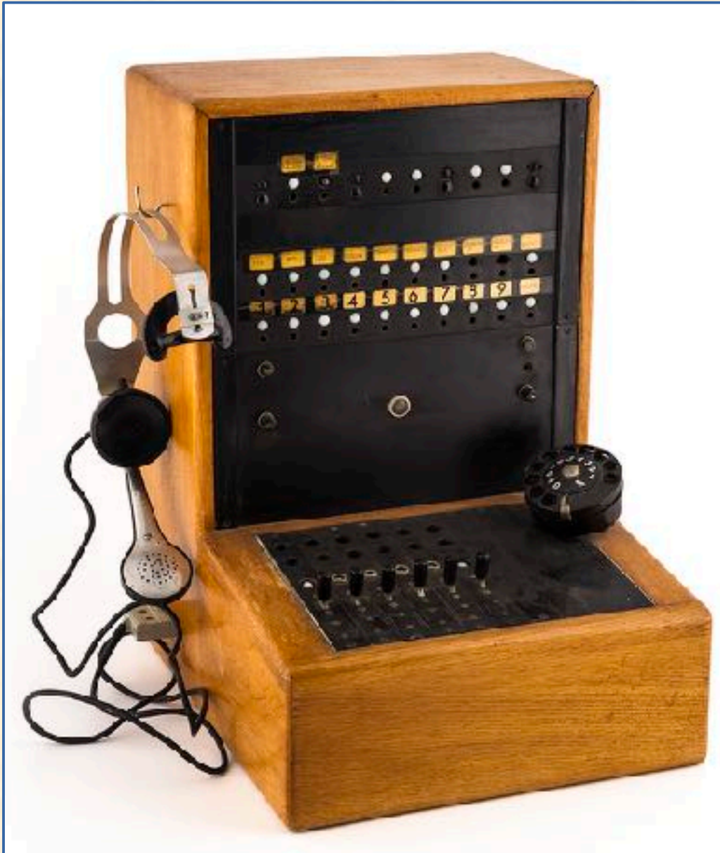
Centralita Ericsson, años 1940