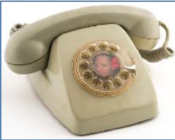
Heraldo sobremesa, años 1960-70