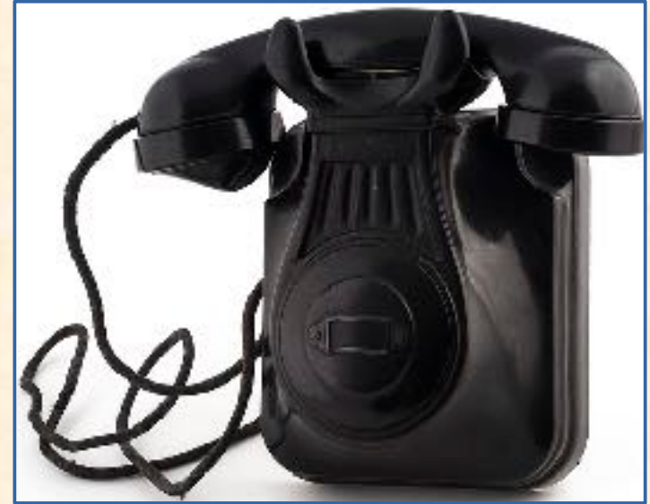
Standard Eléctrica, años 1940-50