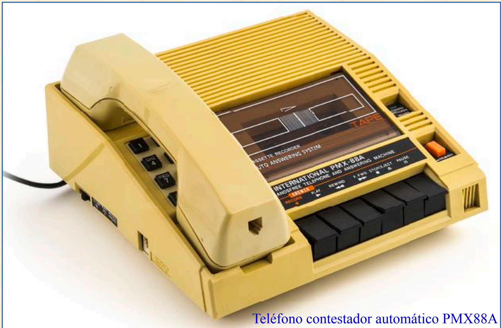
Teléfono contestador automático PMX88A