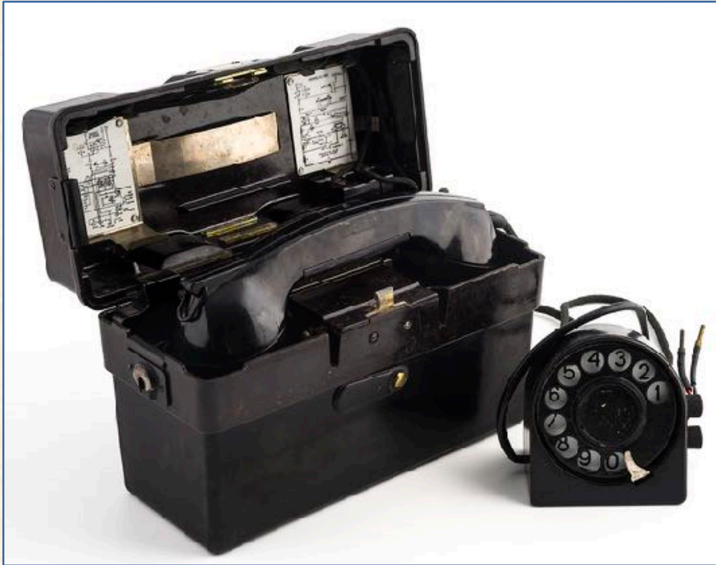
Lorenz (Standard Elektrik) T33, años 1940