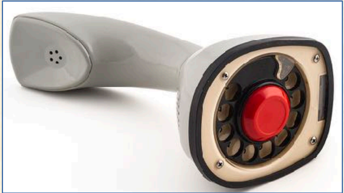
Ericsson modelo Cobra Ericophone, 1969