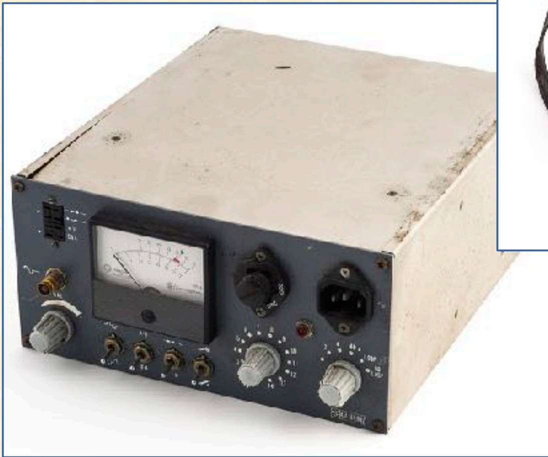
Equipo de medidas eléctricas de las líneas telefónicas