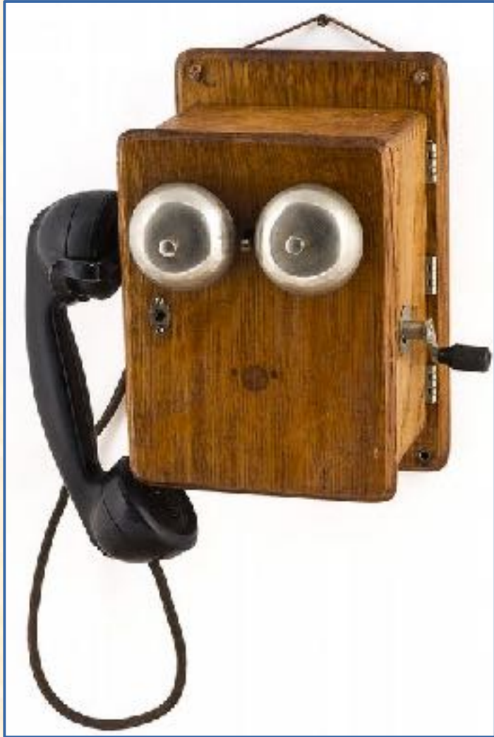
Standard Eléctrica, años 1920-1930