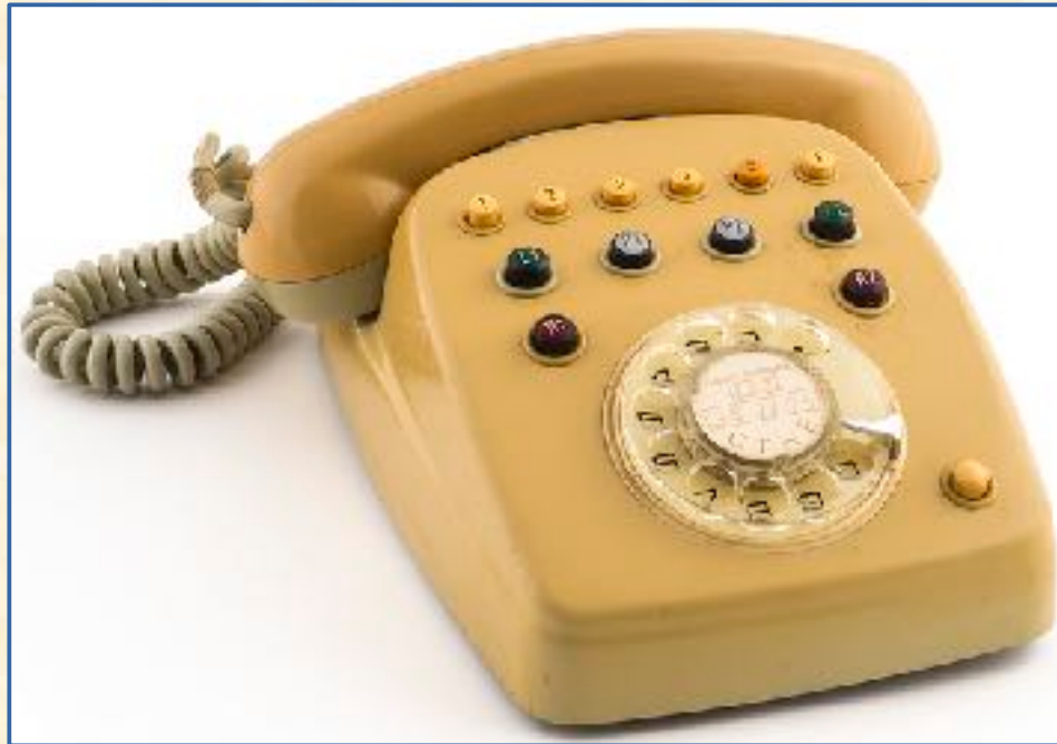
SATAI, terminal de centralita