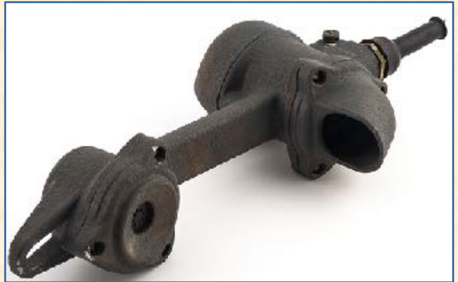
Microteléfono estanco de barco