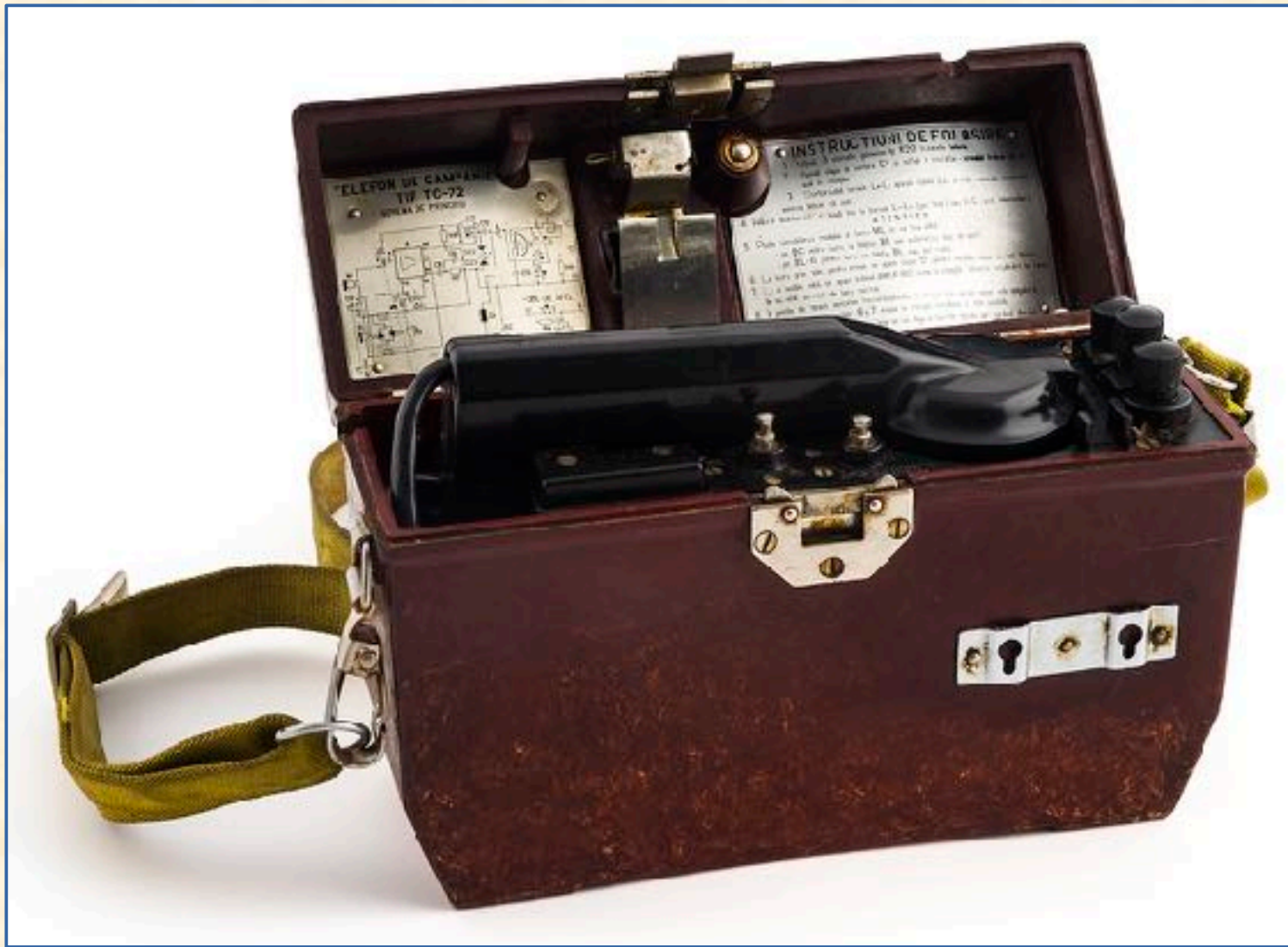
Teléfono de campaña TC72 Rumano. En Baquelita .Años 1970