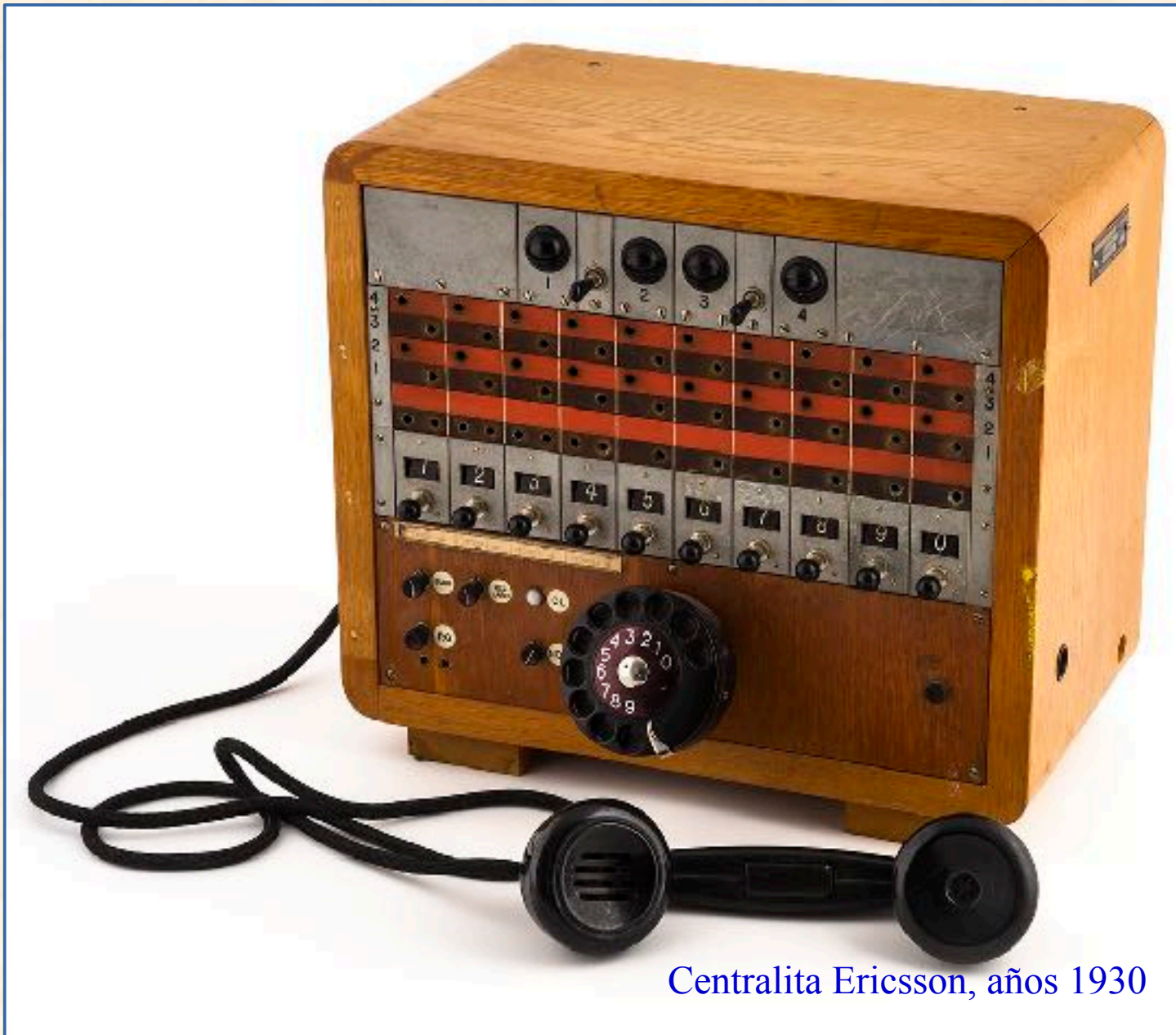
Centralita Ericsson, años 1930