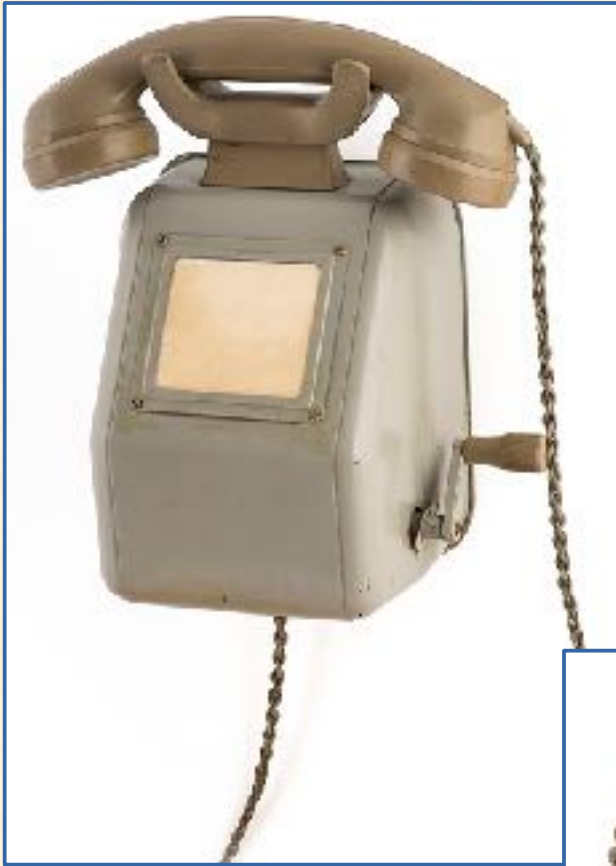
Teléfono para los ferrocarriles alemanes, Siemens, 1939