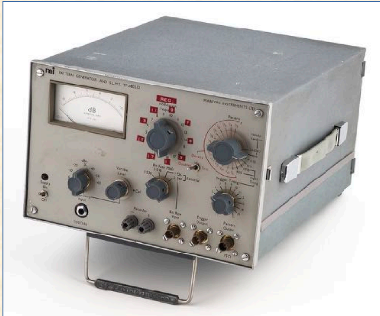
Generador de señal Marconi