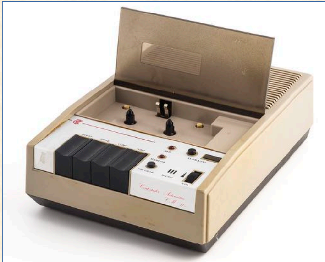
Contestador automático, comercializado por CTNE CM11