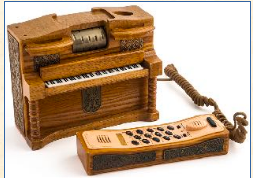
Teléfono con caja de música, fabricado en China