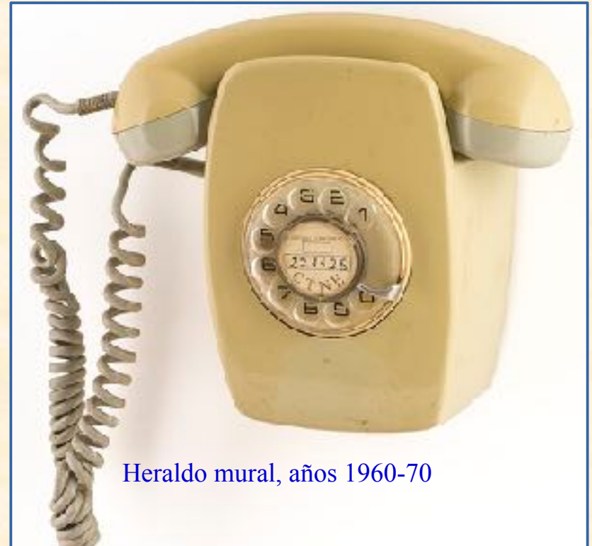
Heraldo mural, años 1960-70