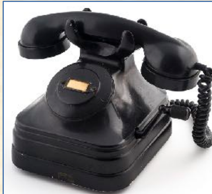
Standard Eléctrica, años 1930