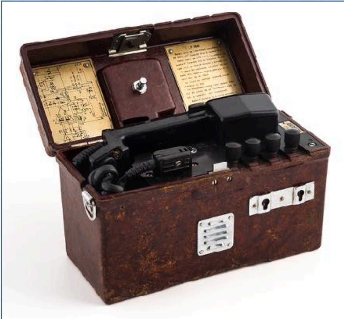
Modelo F1603 Rumano, años 1970