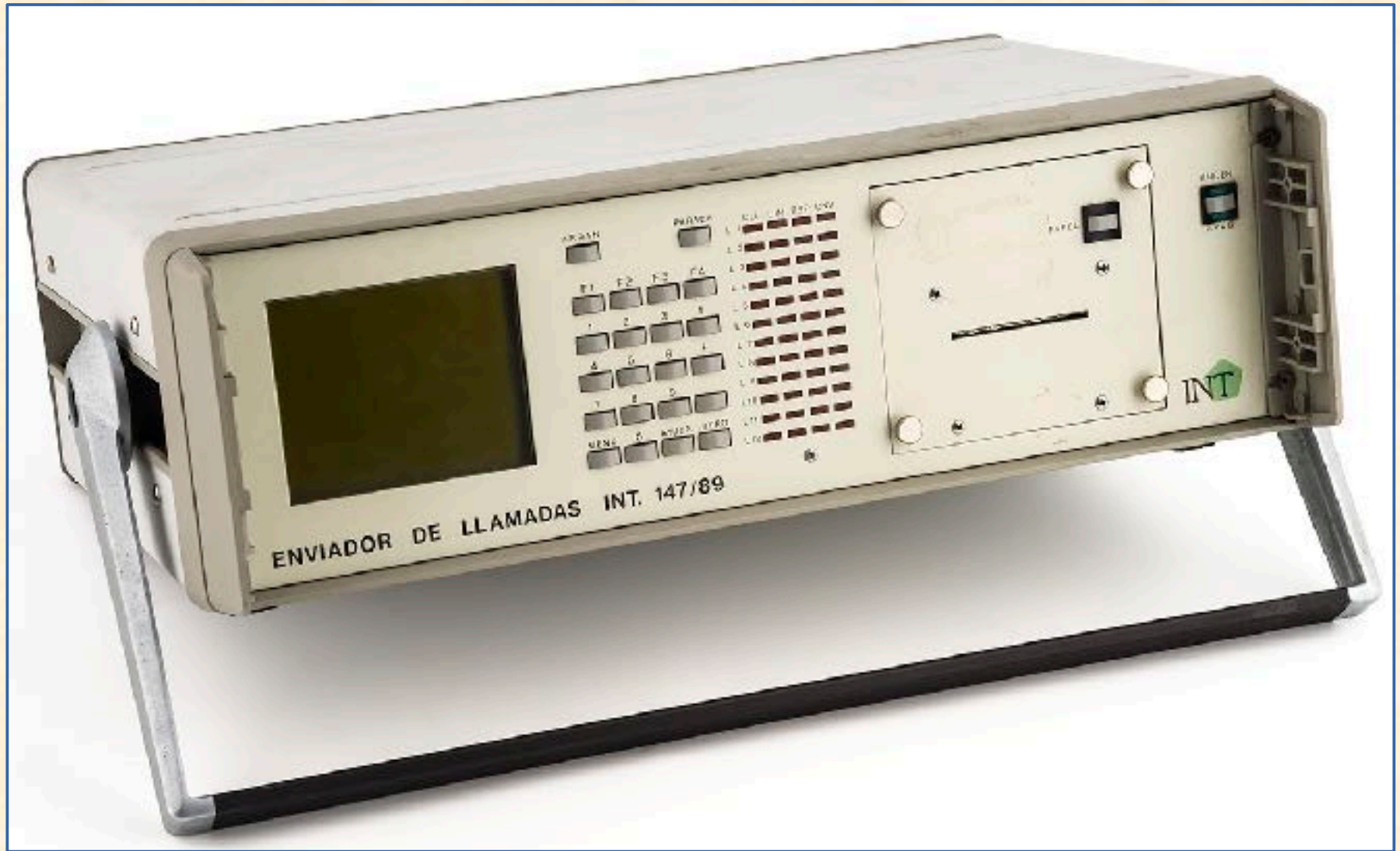
Enviador de llamadas para pruebas de las redes telefónicas