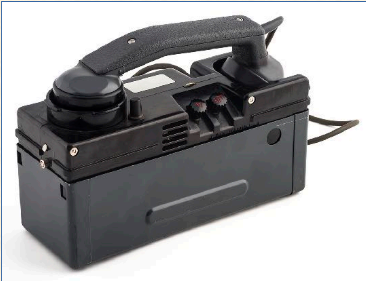
Teléfono de campaña alemán