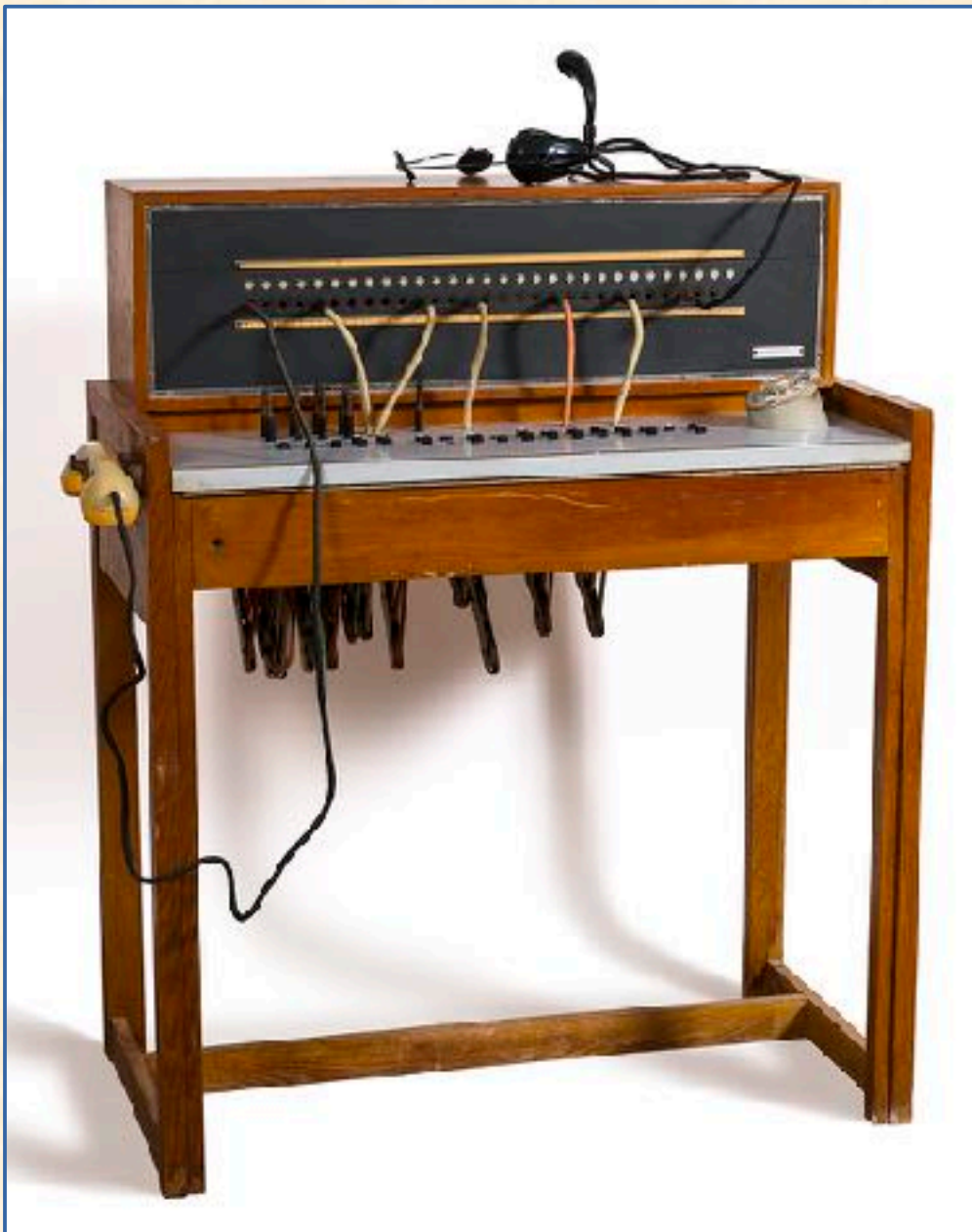
Centralita Standard Eléctrica, años 1940-50