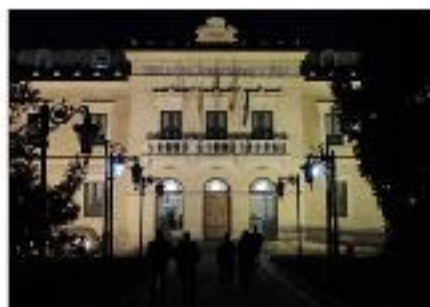
Edificio de la Diputación Provincial de Cuenca

Con la tecnología de Google Traductor de C