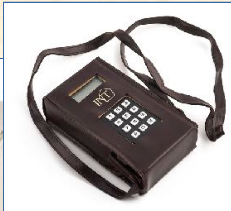
Comprobador de averías de líneas telefónicas para celadores