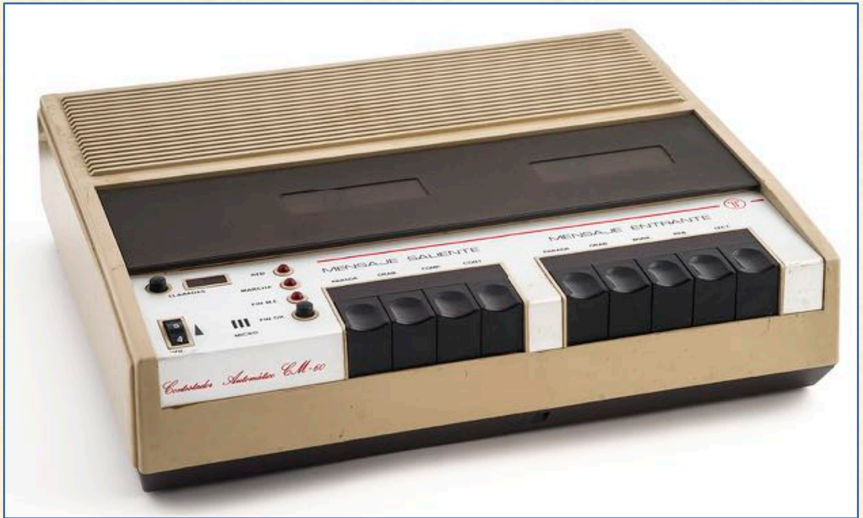
Contestador automático comercializado por Telefónica CM60