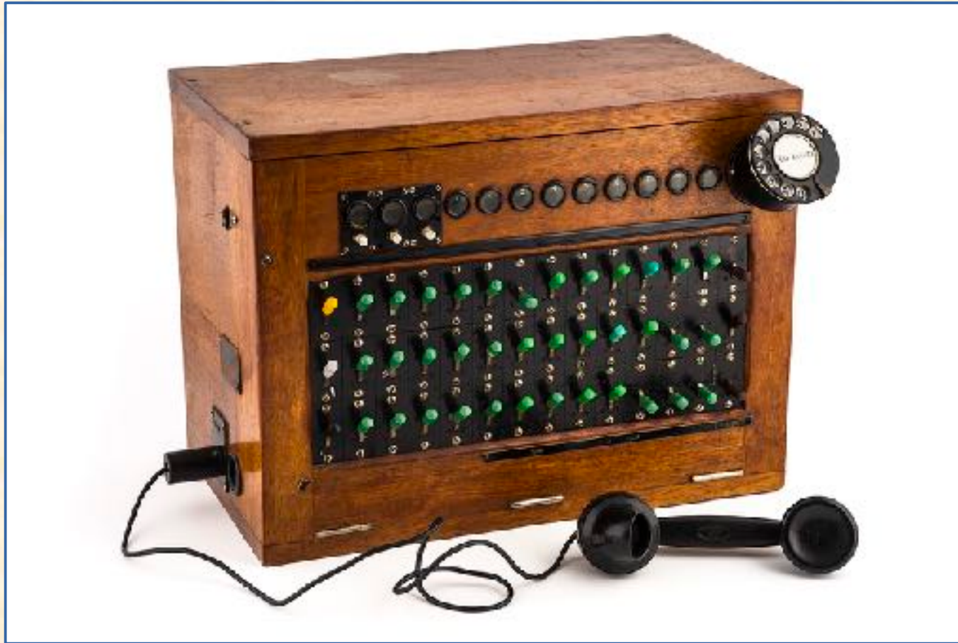
Centralita de llaves Standard Eléctrica, años 1920-30