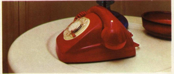
TELEFONO HERALDO AUTOMATICO

Cualquiera de los aparatos telefónicos de los modelos Heraldo o Góndola de sobremesa automáticos o de B. C. pueden servir como portátiles.