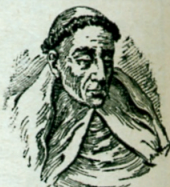
TÉLLEZ (Fray Gabriel), conocido por Tirso de Molina.