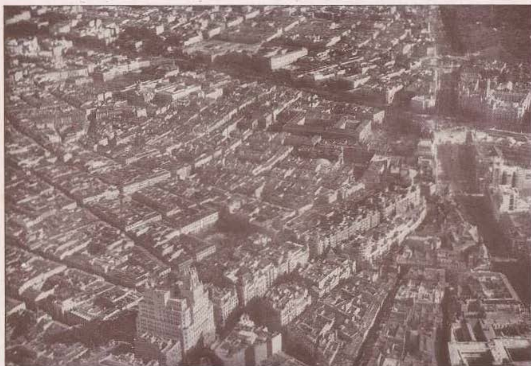
Nuestro edificio fotografiado por la fachada a la calle de Valverde