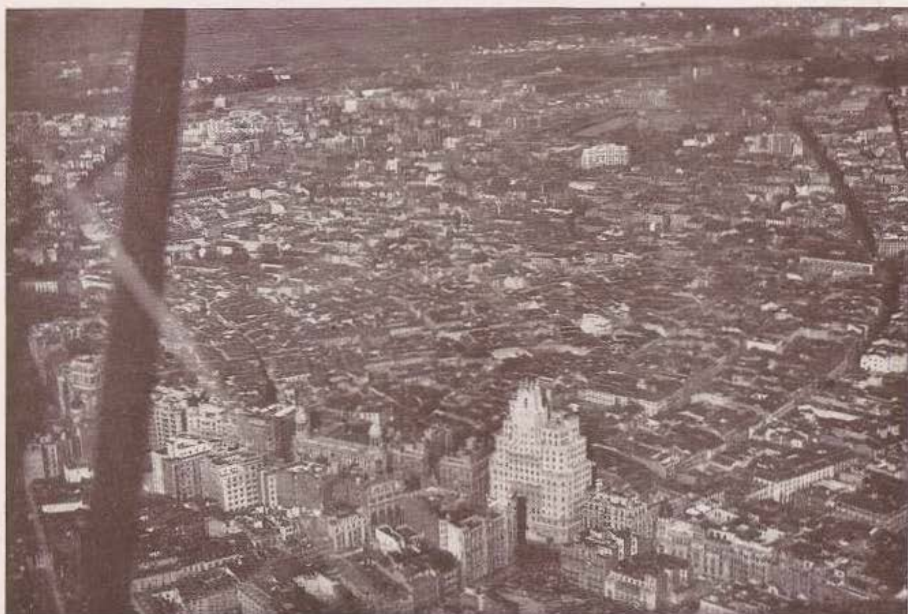
Perspectiva de nuestro edificio visto de frente