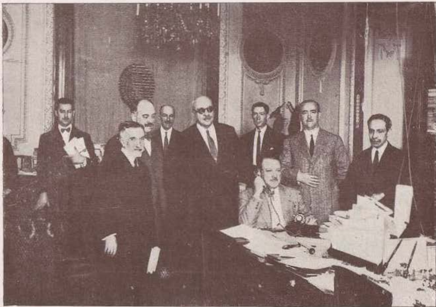
Servicio España-Alemania. — El ministro de la Gobernación hablando con el ministro del Interior, en Berlín, en el momento de la inauguración

El éxito del servicio telefónico internacional, en conjunto, depende de todas las naciones que en él intervienen,